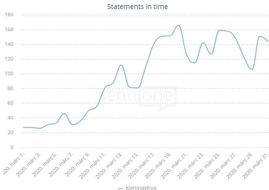
1. ábra A koronavírussal kapcsolatos cikkek napi eloszlása

Március elején a vizsgált oldalak még mindössze napi 20 cikket tettek közzé, március 9-étől azonban fokozatosan emelkedett a publikált írások száma. Március 17-e és a hónap vége között stabilan napi 100-160 cikk jelent meg a koronavírussal kapcsolatban, csak ezen a 15 oldalon.